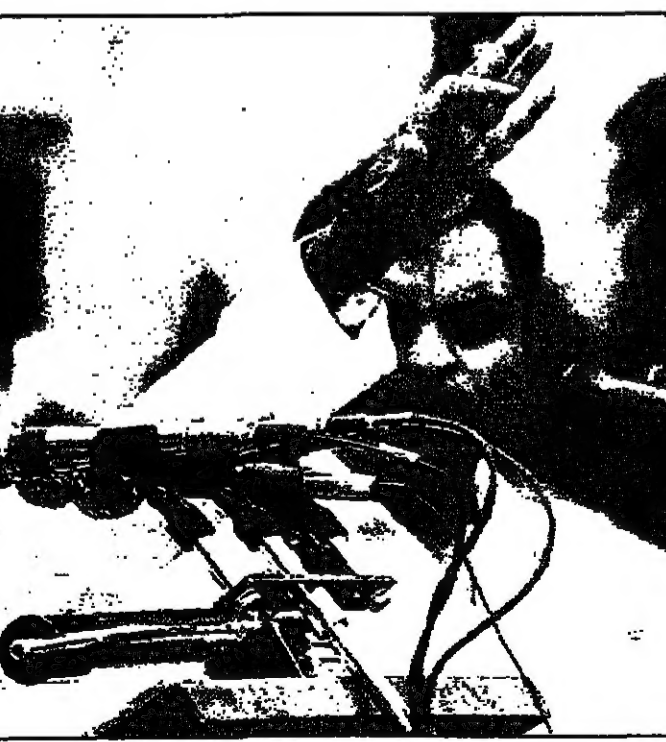
رئيس الحكومة الهندي مه ديبي غودا خلال لقاء صحافي عقبه امس في نيودلهي اعلان رفضه الاستقالة

حزب المؤتمر الهندي يدعو احزاب الائتلاف الى دعم مساعيه لتولي السلطة